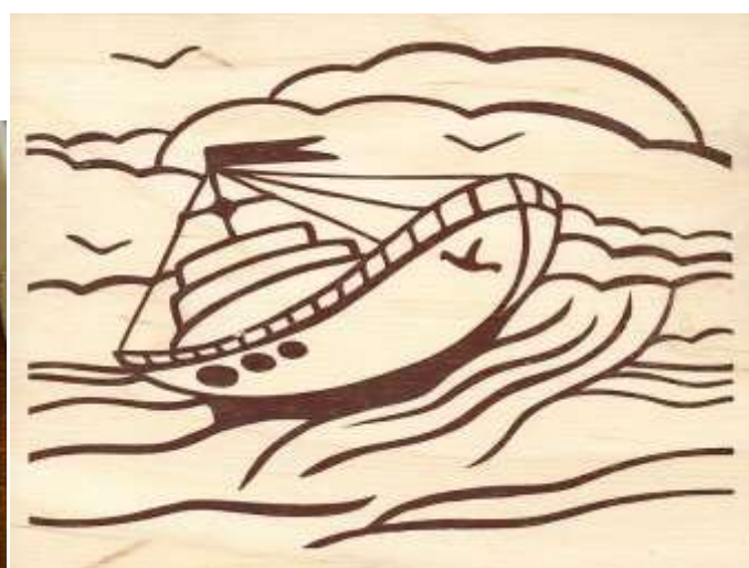
Апликация по выжиганию