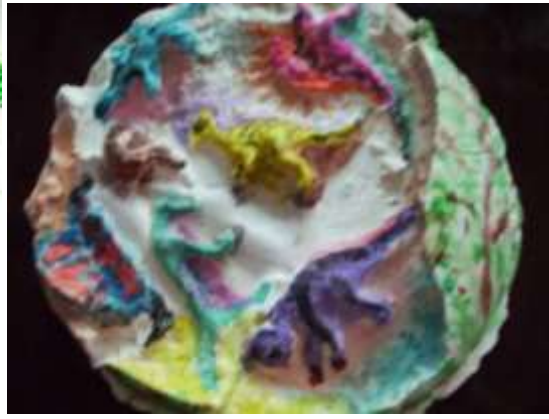
ПОДДЕЛКИ ИЗ ГИПСА