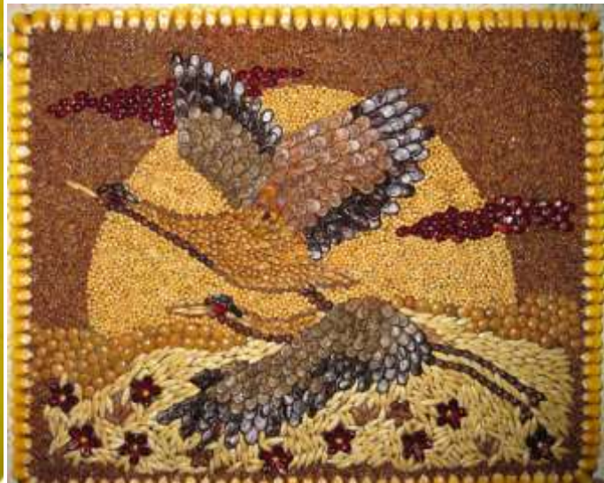
АПЛИКАЦИИ ИЗ ПРИРОДНОГО МАТЕРИАЛА