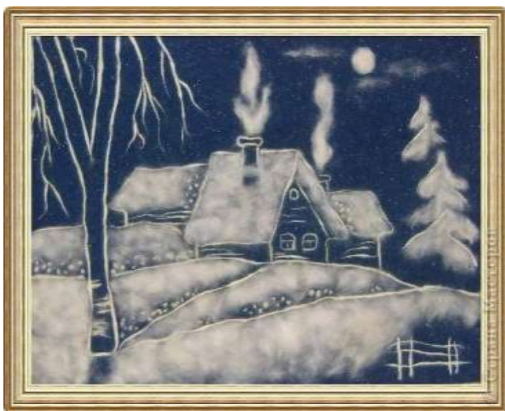
АПЛИКАЦИИ ИЗ ВАТЫ «ЗИМНИЙ ЛЕС» и «ЗАЙЧАТА В ЗИМНЕМ ЛЕСУ»